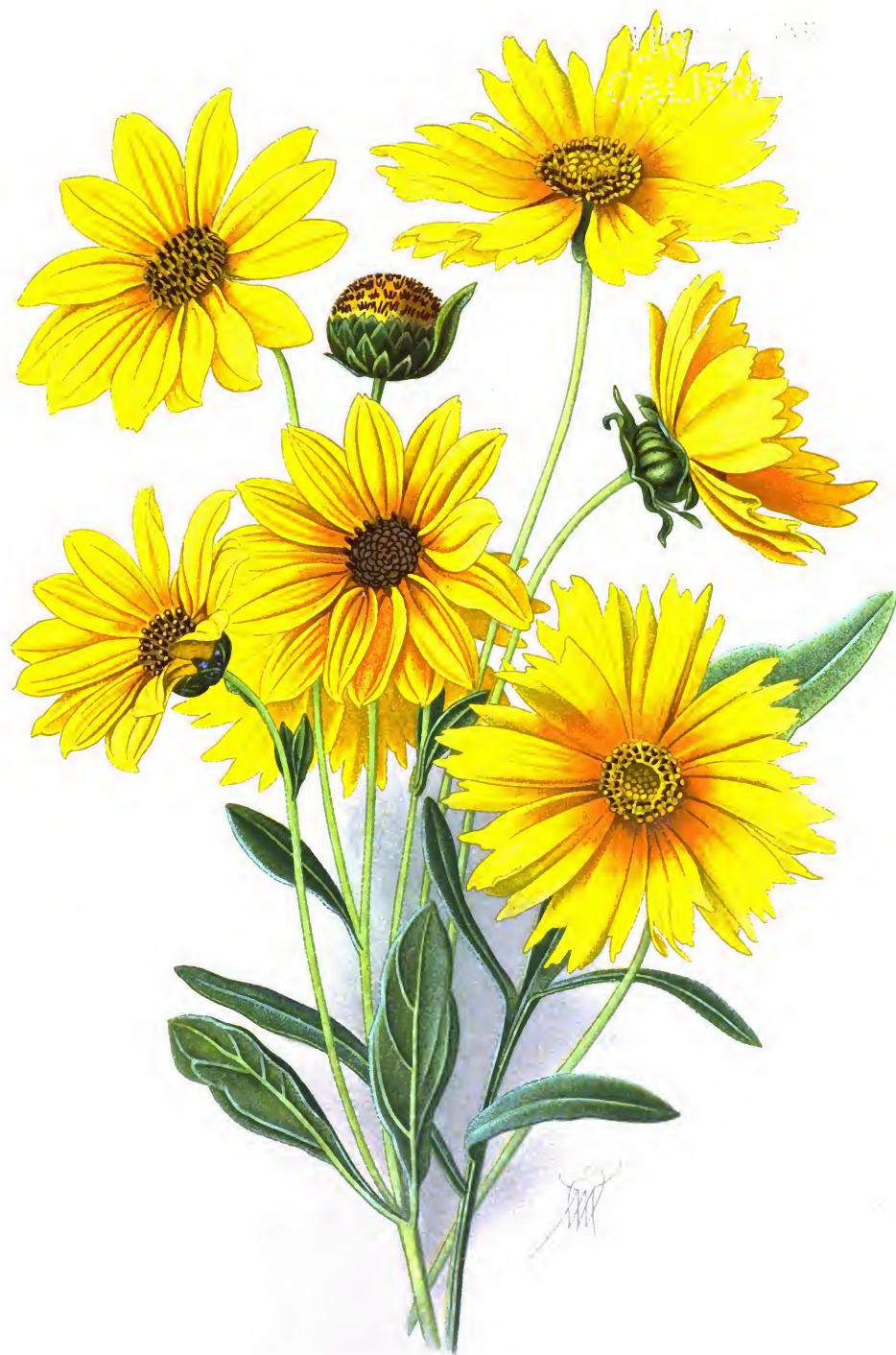
Harpalium rigidum " Coreopsis grandiflora .